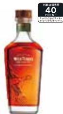
ワイルドターキー マスターズキープコーンストーン 750ml 22,000円