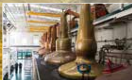
画期的なポットスチルと精溜器