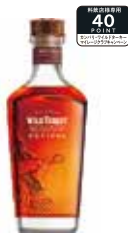
ワイルドターキー マスターズキープリノバイブル 750ml 22,000円