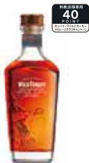
ワイルドターキー マスターズキープボトルドインボンド 750ml 22,000円