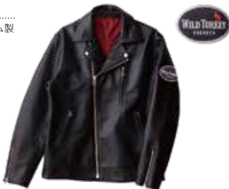
Mサイズ: 景品番号 WT70019