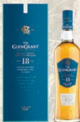
グレングラント 18年 700ml 43%

15年の熟成と50%のハイブルーフがもたらす深み。芳醇な香りと味わい、複雑な余韻。