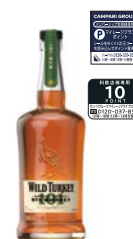
ワイルドターキー ライ 101 750ml 5,500円