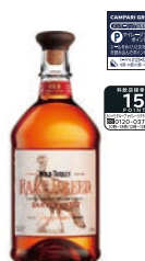
ワイルドターキー レアブリード 700ml 6,798円