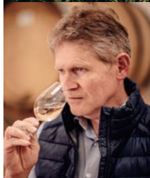
ドミニク・ドゥマルヴィル