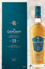
グレングラント 21年 700ml 46%

バーボン樽とシェリー樽それぞれで21年以上の熟成を経た原酒をヴァッティングし、冷却ろ過をせずにボトリング。グレングラントの歴史に新しい章をなす一本。