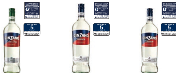
チンザノ ベルモット エクストラドライ 750ml 1,573円 チンザノ ベルモット ビアッコ 1000ml 1,804円 チンザノ ベルモット ビアッコ 750ml 1,573円

※製品画像・価格は2024年現在のものです。ボトルデザイン及び価格は変更の可能性があります。 ※価格は希望小売価格(税込)です。 ※終売済みの製品に貼付されているシールも有効です。