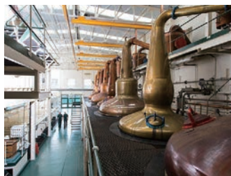
画期的なポットスチルと精溜器

バーボン樽とシェリー樽それぞれで21年以上の熟成を経た原酒をヴァッティングし、冷却ろ過をせずにボトリング。グレングラントの歴史に新しい章をなす一本。