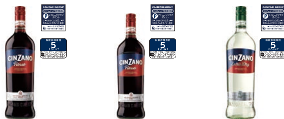
チンザノ ベルモット ロッソ 1000ml 1,804円 チンザノ ベルモット ロッソ 750ml 1,573円 チンザノ ベルモット エクストラドライ 1000ml 1,804円