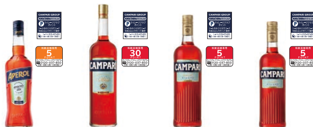
アペロール 700ml 1,947円 カンパリ 3000ml 17,380円 カンパリ 1000ml 2,893円 カンパリ 750ml 2,277円