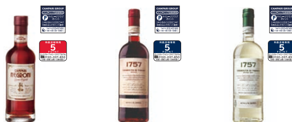
カンパリ ネグロニー 500ml 2,310円 チンザノ ベルモット 1757 ロッソ 1000ml 3,443円 チンザノ ベルモット 1757 EX ドライ 1000ml 3,443円