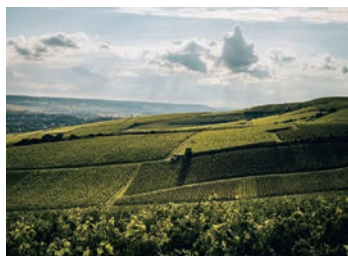
グラン・クリュ アイ村